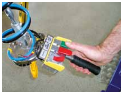
Boîte manuelle à boutons (soupapes)

La gamme EQUIBLOC AIR comprend 5 modèles d'équilibreurs de charges pour des charges à manipuler allant de 70 kg à 350 kg*.